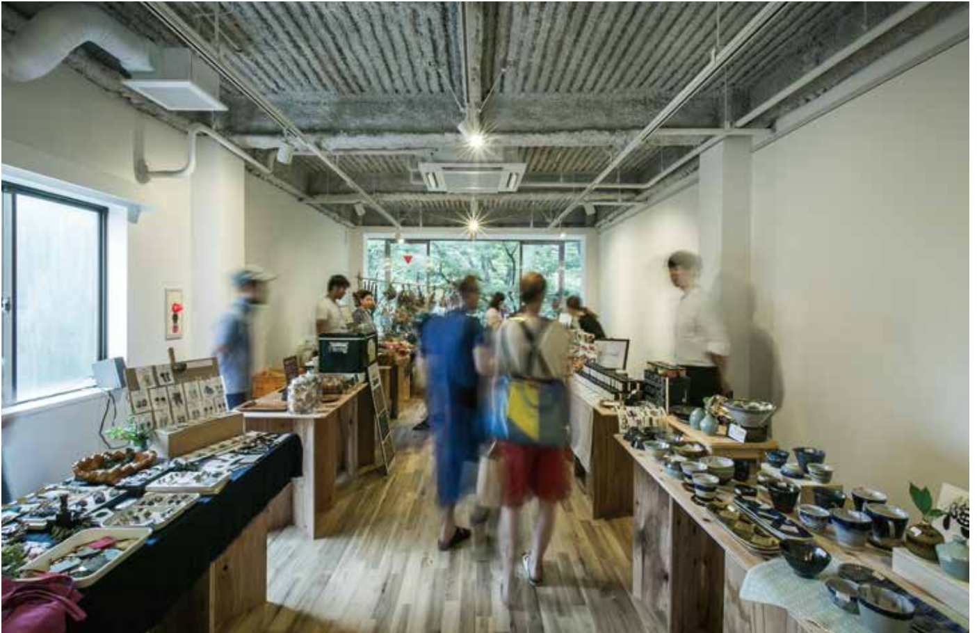
【マルシェ形式の使用例】 イチとニ市 毎月開催イベント